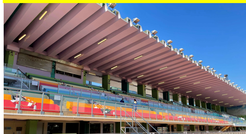
飛達秋季田徑錦標賽2021_1128(運動員及家長指南)